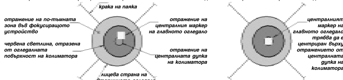
Главното огледало е леко разколимирано.

С това процедурата по грубото колимиране е готова. Поздравления! За колимирането на вторичното огледало са не-